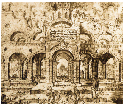
Замальовка архітектурних споруд Києва XVII століття (автор — Абрахам ван Вестерфельд) Дата створення: 1651 р.

Таким чином, образ України у творчості Вестерфельда постає багатограним. Це і територія воєнних дій, і простір життя козацтва, і природне середовище, і частина ширшого європейського історичного процесу.