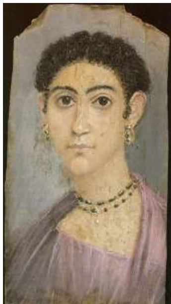
Рис. 3. «Портрет жінки». II ст.

Ще одним вагомим джерелом, що дозволяє проаналізувати основні елементи еволюції цього древнього мистецтва у більш пізній період, є візантійські ікони, які датуються VI-VII ст.