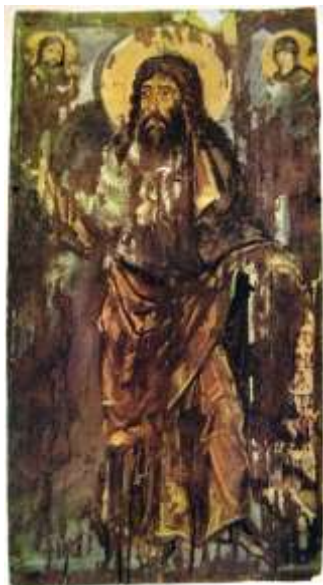
Рис. 4. «Іоанн Хреститель». IV ст.