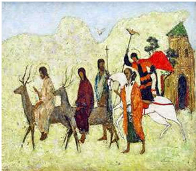
Рис. 9. Кара О. «Небесні гості на Різдво». 2010 р.

Творчі монументальні роботи, виконані в техніці гарячої енкаустики, довели свою творчу неповторність та довговічність, і яскравим прикладом цього є настінні розписи інтер'єрів київських художників-монументалістів Віталія Павловича Буйгашева й Алли Борисівни Буйгашевої у техніці гарячої енкаустики: бювет у місті Саки – розпис «Море», 1986 р. (рис. 10), санаторій «Полтава» – розпис «Нептун», 1987-1988 р. (рис. 11).