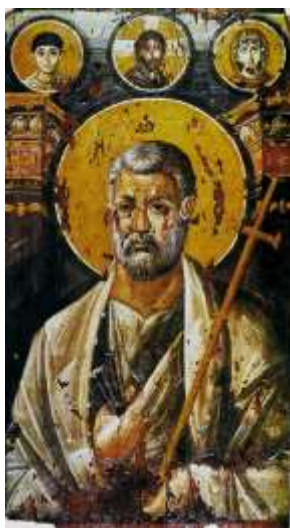
Рис. 6. «Апостол Петро». IV ст.