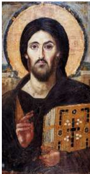
Рис. 5. «Христос Спаситель». VI ст.