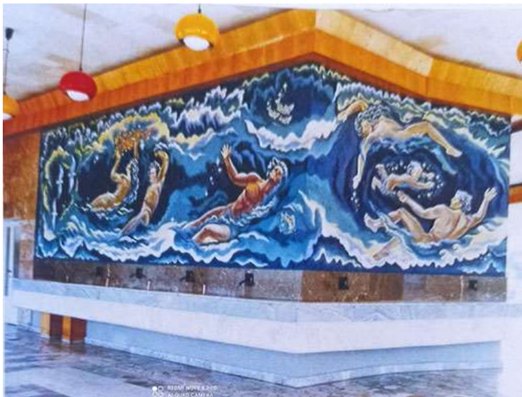
Рис. 10. Буйгашев В., Буйгашева А. «Море». Саки, 1986 р.

На додаток, деякі роботи на сьогодні втрачені, і не тому, що погано збереглися. В результаті приватизації архітектурних об'єктів власники на свій розсуд під час ремонтів змінювали оформлення інтер'єрів, знищуючи багато монументальних робіт у техніці енкаустики.