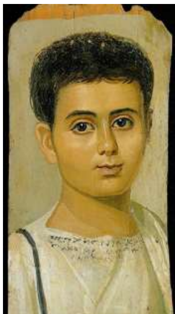
Рис. 2. «Портрет хлопчика». Сер. II ст.