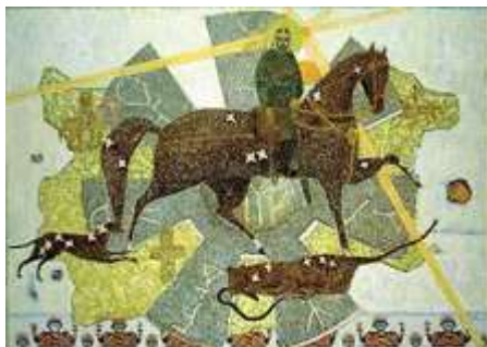
Рис. 8. Кара О. «Святий Георгій» 2014 р.