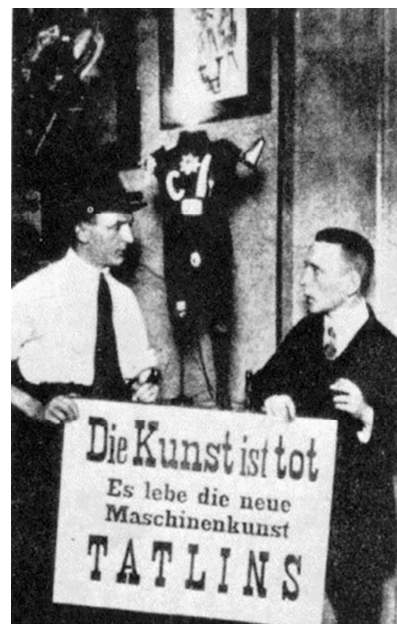
Рис. 4. Георг Грос (праворуч) та Джон Хертфілд. Напис на плакаті: «Мистецтво померло — хай живе нове виробниче мистецтво Татліна!»