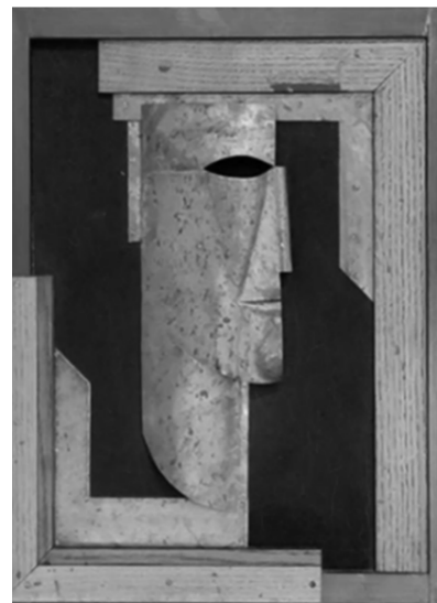
Рис. 2. Василь Єрмилов. Портрет художника Олексія Почтенного. 1924 р.