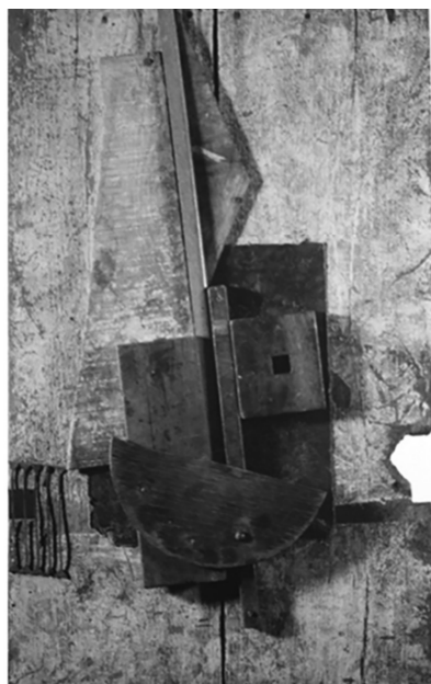
Рис. 3. Володимир Татлін. Бандура (Жовто-блакитний рельєф). 1914–1915 рр.