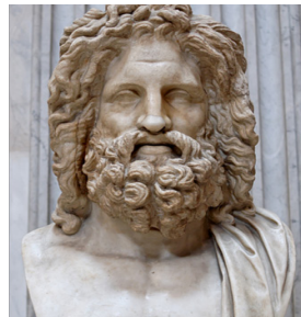
Рис.1 Федій. статуя Зевса в Олімпії. Рис.2 копія автор невідомий Зевс