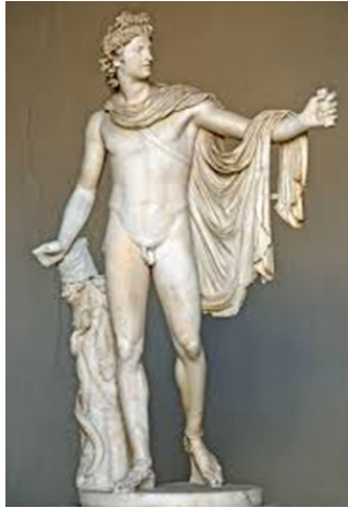
Рис. 5 Леохар. Аполлон Бельведерский

описувати з лірою або лавровим вінком, які вирізняли його зв'язок із музикою, поезією та перемогою. У художніх образах Аполлона могли описувати з лавровим вінком або з лірою яке вирізняло його зв'язок з музикою та поезією. Нерідко у художніх образах Аполлона пов'язували з гармонією світу. Саме через цей образ митці прагнули передати ідею поєднання природи та людської душі.