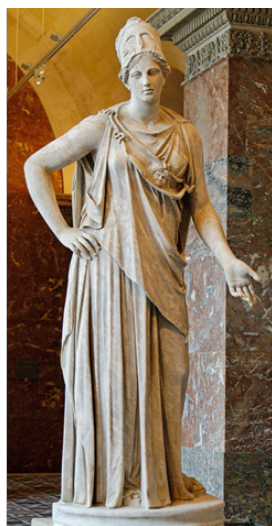
Рис. 3 Федій. Афіна Парфенес. Рис.4 Эвфранор. Афіна Маттеї

Вагому роль у давньогрецькому мистецтві посідав у свою чергу образ Аполлона, бога світла, гармонії та мистецтва. У скульптурі він часто з'являється у вигляді юнака з ідеальними балансом тіла, що символізує красу, молодість і духовну рівновагу. ( рис. 5) Аполлона могли