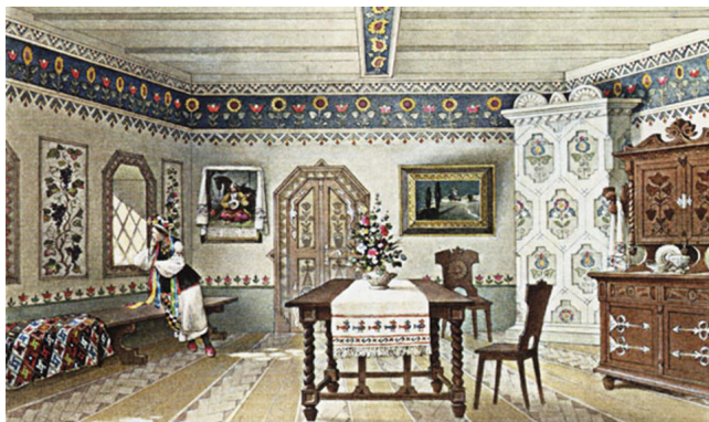
Рис. 2. А. Ждаха. Проєкт інтер'єру світлиці в українському стилі. Папір, акварель.