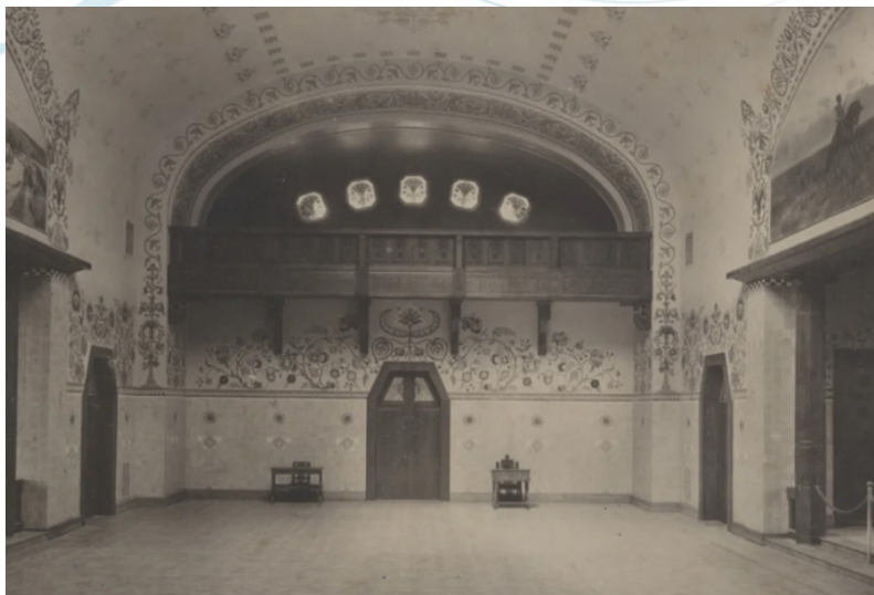
Рис. 1. Фото інтер'єра вестибюлю та зали земських зборів, зведених за проєктом В. Кричевського. Фото Йосипа Хмелевського 1908 р. Світлина з фондів Полтавського краєзнавчого музею імені Василя Кричевського. Фото з сайту: https://localhistory.org.ua/rubrics/building/budivlia-shcho-zapochatkuвала-ukrayinskii-modern/