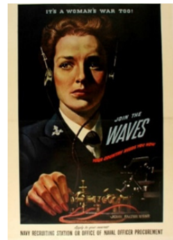
Рис. 10. Постер 9