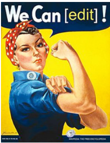
Рис.2, Постер 1

Для прикладу, американський дизайн у другу світову війну задіяв використання графічного дизайну для пропагандистських постерів, візуальної комунікації, підвищення морального духу, підтримки армії, мобілізації цивільного населення та формуванні візуального образу незламності нації в період війни. Це високо художньо, в реалістичному стилі подано в постерах (постери 1 – 9 на рисунках 2 – 10) [7].