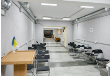
Рис.1 Захисні укриття та споруди подвійного призначення Інформаційне забезпечення, як правило, виконується відео та аудіо-трансляціями, спрямованими на громадянську мужність та уособлення негативу російських загарбників.

Виклад результатів дослідження. Згідно з [3,4], в житлових і громадських спорудах – школах, садочках та лікарнях передбачено захисні укриття та споруди подвійного призначення – захист населення внаслідок надзвичайних ситуацій, військових дій або терористичних актів (рисунок 1). У столиці зведено нові автономні протирадіаційні укриття: «Це автономні споруди, здатні забезпечити безпеку мешканців навіть у разі тривалого відключення комунікацій» [5], однак, щодо інклюзійних особливостей в цих об'єктах не вказано.