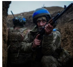
Рис.19 Листівка 3

Цікавими роботами також є колекційна марка «Російський військовий корабель, все», рисунок 20, [17]; етикетка біла кругла «Слава Україні!» (воїн), рисунок 21, [18]; серед численних – відкритий до Дня авіації України мурал «Привид Києва», рисунок 22,[19].