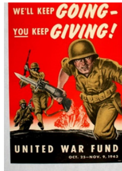
Рис. 9. Постер 8