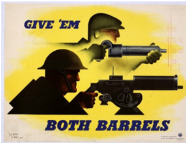
Рис. 4. Постер 3

Текст у перекладі: рис.2 «Ми можемо зробити це!»),