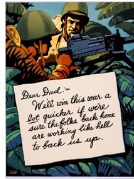
Рис.7. Постер 6

Текст у перекладі: рис. 4 «Дамо їм з обох стволів»; рис. 5 «Це може трапитися тут!»; рис. 6 «Хочете програти війну? Вимкніть будильник... поспіть довше!»; рис.7 «Любий тато, ми виграємо війну ЗНАЧНО швидше, якщо будемо впевнені, що люди вдома працюють як прокляті, щоб підтримати нас!».