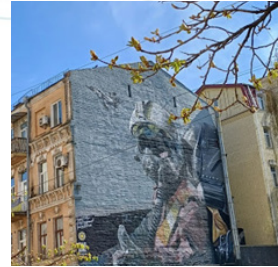
Рис. 20 Марка Рис. 21 Етикетка Рис. 22 Мурал (стріт-арт)