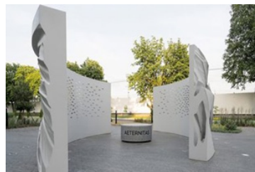
Рис. 15 Проект Меморіалу