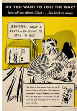
Рис. 6. Постер 5