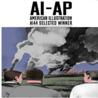
Рис. 16 Ілюстрація

Оригінальні картинки з привітаннями до дня народження під час війни [14](листівка 1, рисунок 17). Патріотична мотиваційна картинка [15] (листівка 2, рисунок 18) Фотоісторії ЗСУ [16] (листівка 3, рисунок 19). Також, є патріотичні листівки-подяки для воїнів ЗСУ та гарно виконані листівки солдату, українському військовому, захиснику від дівчини, дружини, жінки. Картинка зі словами: «Ти – мій герой, моя гордість, моя надія!»