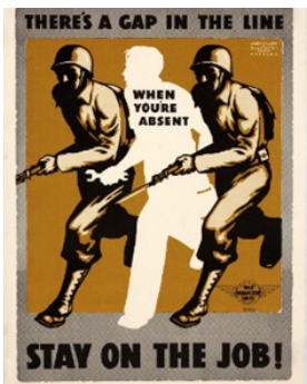
Рис. 8. Постер 7

Текст у перекладі: рис. 4 «Дамо їм з обох стволів»; рис. 5 «Це може трапитися тут!»; рис. 6 «Хочете програти війну? Вимкніть будильник... поспіть довше!»; рис.7 «Любий тато, ми виграємо війну ЗНАЧНО швидше, якщо будемо впевнені, що люди вдома працюють як прокляті, щоб підтримати нас!».