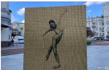
Рис. 14 Світлина балерини

Проект Меморіалу українським розвідникам у Головному управлінні розвідки (ГУР), номіновано на премію Європейського Союзу в галузі сучасної архітектури – Mies van der Rohe Award (рисунок 15, [12]). Слід зауважити, що українська дизайнерка Женя Полосіна отримала американську премію за ілюстрацію до статті «Чотири сценарії закінчення війни в Україні» у The New York Times [13], (рис. 16).