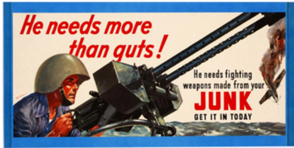
Рис. 3. Постер 2