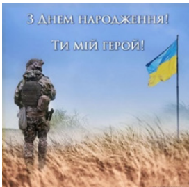
Рис.17 Листівка 1

Оригінальні картинки з привітаннями до дня народження під час війни [14](листівка 1, рисунок 17). Патріотична мотиваційна картинка [15] (листівка 2, рисунок 18) Фотоісторії ЗСУ [16] (листівка 3, рисунок 19). Також, є патріотичні листівки-подяки для воїнів ЗСУ та гарно виконані листівки солдату, українському військовому, захиснику від дівчини, дружини, жінки. Картинка зі словами: «Ти – мій герой, моя гордість, моя надія!»