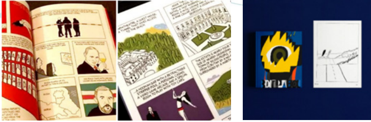
Рис. 12 Комікс про кривавого Путіна. Рис. 13 Обкладинка артбука

В артоб'єкті – інсталяції рисунок 14, [11], зображена світлина балерини, що надрукована на скріпленій смолою панелі зі стріляних гільз за допомогою ультрафіолетового принтера. Слова авторки: « ...Працюючи над проектом, я хотіла передати контраст жорстокості війни та мистецтва...»