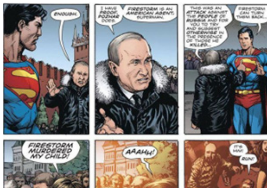
Рис. 11 Ілюстрація комікса «зі злим Путіним і Суперменом».

У США випустили комікс зі злим Путіним і Суперменом – подано вибух Кремля і втечу Путіна (рисунок 11) [8].