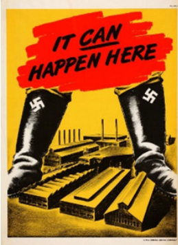
Рис. 5. Постер 4

також під назвою «Розі-клепальниця» за зразком культового узагальненого образу сильної жінки – працівниці військового виробництва; рис. 3 «Йому потрібно щось більше за міцні нерви, Йому потрібна зброя, виготовлена з вашого брухту, здавайте зараз!