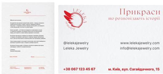
3.Фірмовий стиль, бланк ,візитка, 4 курс

Візуальний аналіз студентських проєктів у галузі графічного дизайну засвідчив типові проблеми: відсутність чіткої просторової ієрархії, порушення принципів ритму, масштабу, контрасту, золотого перетину та балансу. Це