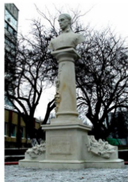
3. Г. Сковорода

Емпіричне дослідження освітнього процесу в провідних мистецьких закладах вищої освіти України виявило низку типових проблем, зокрема відсутність логічної побудови простору, порушення ритмічної організації, масштабних співвідношень, недбале використання контрасту та ігнорування принципу рівноваги. Зазначені помилки зумовлені формальним підходом до засвоєння композиційних принципів [5, с. 86].