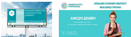
1.Зовнішня реклама(білборд) 3 курс