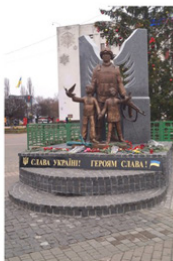
2. Пам'ятний знак «Захисникам України»