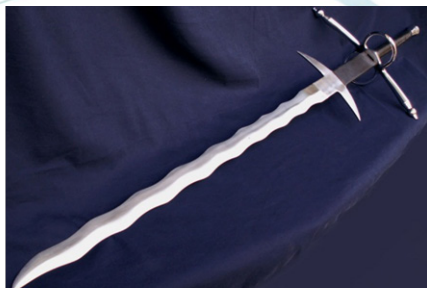
Іл.34.Шеврон 210-ого окремого штурмового полку. Іл.35.Меч «Фламберг»

82-га окрема десантно-штурмова бригада (неофіційна назва «Боривітер») має на шевроні(Іл.36) образ хижого птаха – сокола роду боривітер, що символізує швидкість, силу, рішучість та здатність долати перешкоди. Боривітра часто згадували у українських казках, прислів'ях та піснях як символ охорони, спостережливості та сили.