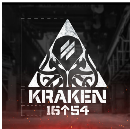
Іл.27. Нарукавний знак спецпідрозділу ГУР «Kraken».

Нарукавний знак елітного спецпідрозділу Головного управління розвідки (ГУР) Міністерства оборони України «Kraken» (Іл.27) складається з кількох ключових елементів, кожен із яких має своє значення: