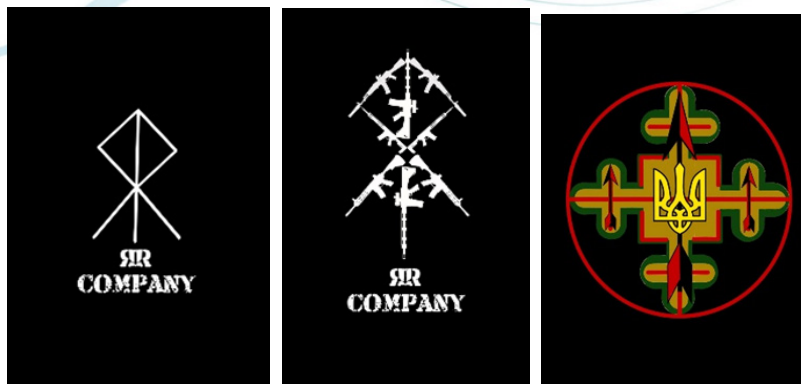
Іл.29. Ескізи до шеврону