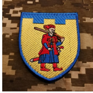
Іл.7.Нарукавний знак 110 ТрО (Запоріжська обл.)