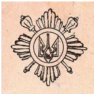
Іл.5.Шеврон Окремої президентської бригади імені Богдана Хмельницького Іл.6.«Сердюцька зоря» - кокарда Сердюцької дивізії, 1918 р

Історичні фігури, як козаки чи князі, інтегруються для підкреслення спадкоємності. Шеврони з козаком на коні нагадують про боротьбу за незалежність. Наприклад, нарукавний знак 110-ї ОБрТрО (Іл.7,8) має вигляд геральдичного щита на жовтому тлі та синьою зубчатою главою, оздоблений синім кантом. Центральним елементом емблеми є козак з мушкетом на плечі, який символізує готовність до захисту рідної землі та відданість принципам патріотизму.