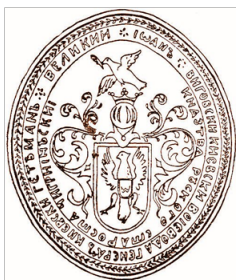
Іл.21.Нарукавний знак 58-мої окремої мотопіхотної бригади імені гетьмана Івана Виговського Іл.22.Герб Івана Виговського за першим привілеєм. Відбиток печатки 1664 року.