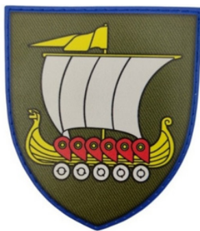
Іл.31.Шеврон 153 окремої механізованої бригади

В нарукавному знаку 153 окремої механізованої бригади (Іл.31) реалізовано символіку механізованого підрозділу через ретроспективу літописних згадок про «Повість временних літ», де було описано легендарний похід київського князя Олега Віщого на Царгород, під час якого Олег звелів зробити своїм воїнам колеса і поставити на них кораблі.