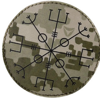
Іл.25. Патч- оберіг з рунічною символікою

З'явилися патчі, які використовують не як ідентифікатори окремих підрозділів, а як символ приналежності до військових. До таких відносяться патчі-оберіги (Іл.25).