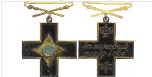
Іл.19.Нарукавний знак 28-ма окрема механізована бригада імені Лицарів Зимового Походу. Іл.20.Залізний Хрест (другий випуск)

58-ма окрема мотопіхотна бригада імені гетьмана Івана Виговського названа на честь Гетьмана Війська Запорозького та має шеврон (Іл.21), де зображений фірмовий гетьманський герб. А ще – латинське гасло « Simul ad victoriam », що в перекладі – «Разом до перемоги». Отже, у центрі шеврона – герб родини Виговських, що є різновидом герба абданк (Іл.22). Саме такі герби використовувались як родові герби кількох польських, литовсько-білоруських, українських шляхетських родів за часів Королівства П'ястів, Речі Посполитої. Цікаво: саме таким гербом володіли й Богдан та Юрій Хмельницькі.