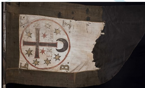
Іл.17.Нашивка 13 БрОП «Хартія». Іл.18.Прапор гетьмана Богдана Хмельницького

28-ма окрема механізована бригада носить почесну назву на честь Лицарів Зимового Походу – учасників Першого зимового походу. Це похід Армії Української Народної Республіки тилами Червоної та Добровольчої армій під проводом Михайла Омеляновича-Павленка, що тривав з 1919 по 1920 рік. Головним завданням Зимового Походу було збереження присутності української армії на українській території шляхом партизанських дій, у той час як її головний отаман Симон Петлюра у справах державної важливості перебував зі своїм штабом у Варшаві. Центральний елемент шеврона – залізний хрест (Іл.19), і це одна з нагород Української визвольної війни 1917-1921 років. І що важливо – єдина бойова відзнака армії УНР (Іл.20).