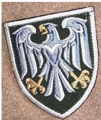
Іл.36.Нашивка 82-гої ОДШБ («Боривітер»)

82-га окрема десантно-штурмова бригада (неофіційна назва «Боривітер») має на шевроні(Іл.36) образ хижого птаха – сокола роду боривітер, що символізує швидкість, силу, рішучість та здатність долати перешкоди. Боривітра часто згадували у українських казках, прислів'ях та піснях як символ охорони, спостережливості та сили.