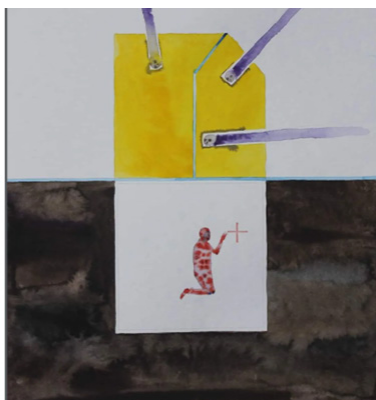
Рис. 3. Данило Мовчан, «Росіяни руйнують життя»,