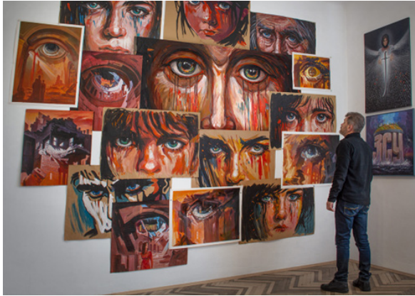
Рис. 2. О. Шупляк. З серії «Очі війни»

дітей до літніх людей. Також деякі роботи нагадують лики святих з давніх ікон. Погляд мучеників які передають всерозуміючий сум, як образи з храмових фресок.