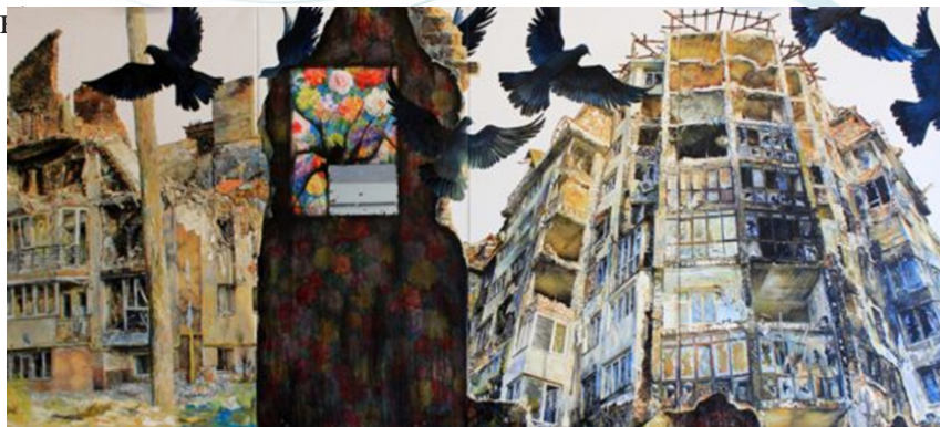
Рис. 1. І. Яровий. Відбитки війни. Дзеркало Ірпінь полотно олія 120х300см

Олег Шупляк всесвітньо відомий український художник, який прославився своєю унікальною авторською технікою оптичних ілюзій «Двовзори» [4, с. 129].